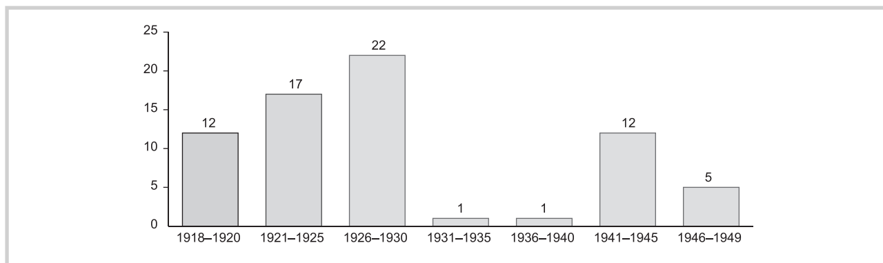
Рис. 1. Число публикаций Н.А. Семашко по вопросам санитарного просвещения населения с 1918 по 1949 г.

Fig. 1. Number of publications by N.A. Semashko about public health education from 1918 to 1949 yrs.